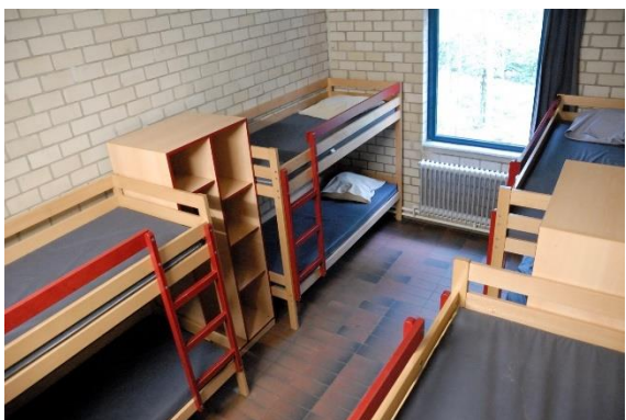
Slaapkamer 8 personen

Enkele sfeerfoto's van de voorbije jaren: